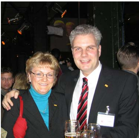
Gewählte Wahlkreiskandidaten bei der Feier in der Fischauktionshalle