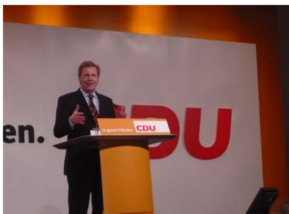
Ministerpräsident Christian Wulff kämpft für Ole von Beust