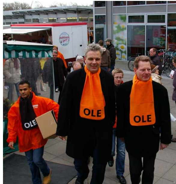
CDU-Lübeck mit Senator Thorsten Geißler in Langenhorn zur Wahlkampfunterstützung

Einen Tag vor den Wahlen hat die CDU im Wahlkreis noch einmal alles gegeben. An CDU-Informationständen in allen Stadtteilen sowie durch Hausverteilungen wurde versucht, die Bürgerinnen und Bürger von der Bedeutung der anstehenden Wahl zu überzeugen. Besonders erfreulich war die Wahlkampfunterstützung der CDU aus Lübeck, die mit Marzipanherzen und guten Argumenten extra angereist war. Auch der CDU-Landesvorsitzende und Finanzsenator Dr. Michael Freytag hat der CDU vor Ort tatkräftig geholfen und auf dem Langenhorner Wochenmarkt um die letzten unentschiedenen Stimmen gekämpft.