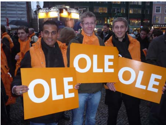
Unser Beitrag zum Ole – Team auf dem Gänsemarkt