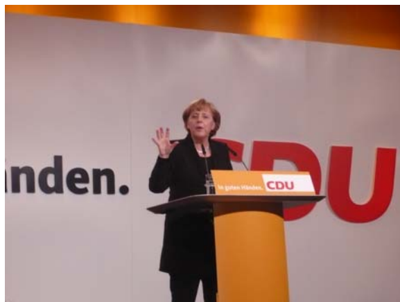
Bundeskanzlerin Dr. Angela Merkel war viermal in Hamburg im Wahlkampfeinsatz