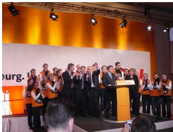
Ein gelungener Auftakt für den Endspurt