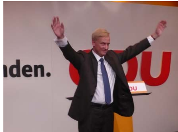
Wahlsieger und Bürgermeister Ole von Beust