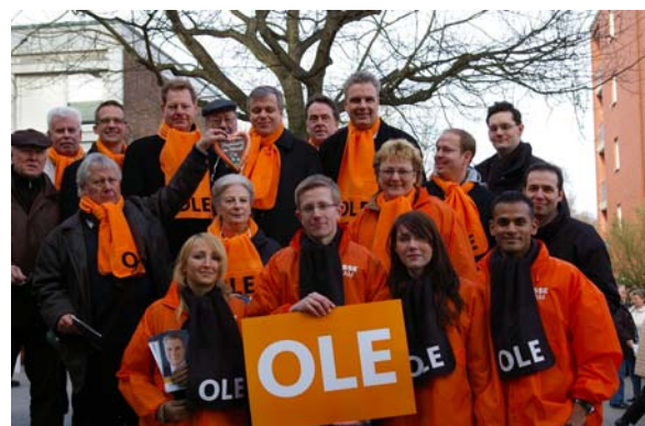
Gruppenfoto zum Wahlkampfendspurt auf dem Langenhorner Markt